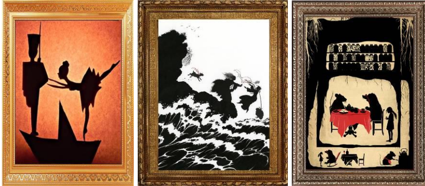
Рис. 7. Примеры картин из музея сказочных образов

На станции в кабинете на стенах висят картины, оформленные в красивые рамки. На картинах образы сказочных героев (9 сказочных образов, оформленных в рамки), известных детям по любимым сказкам. Предлагается внимательно посмотреть на сказочный образ и дать ответ.